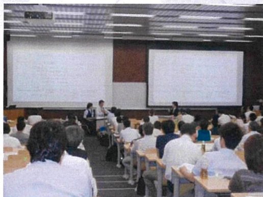
パネルディスカッション